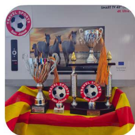
TIRAGE AU SORT